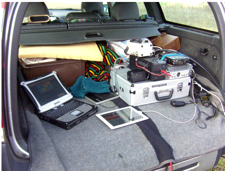
Le "shack" dans le coffre du véhicule !