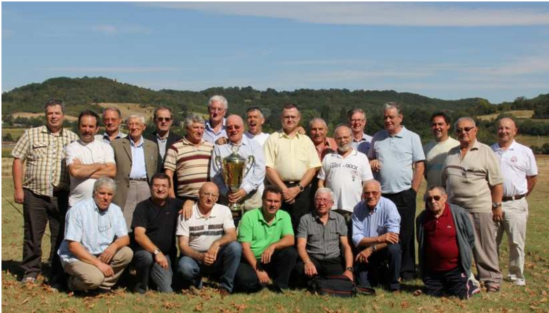
Les Lot-et-Garonnais Champions de France 2011, 2012, ...(2013 ??)