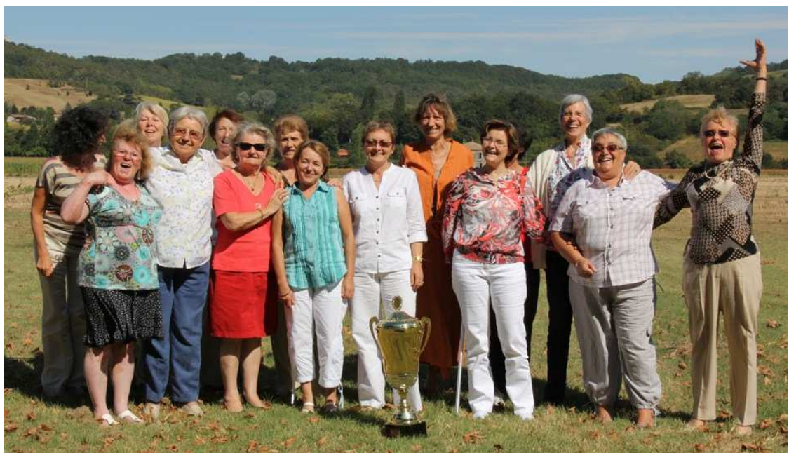
et leurs XYL qui les supportent à longueur d'année